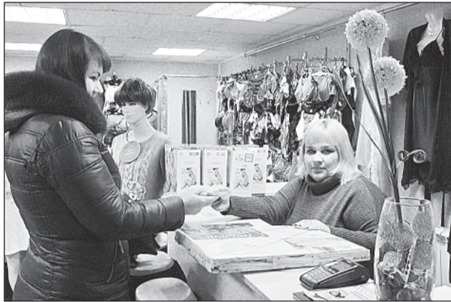
Покупатель получает подарок от магазина «Людмила»

Магазин «Людмила» находится в центре города, по улице Коммунарной, 21 (напротив городской стоматологии).